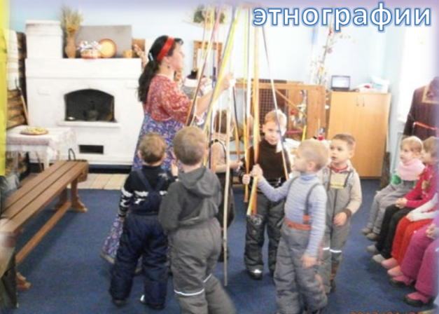
Музей истории и этнографии