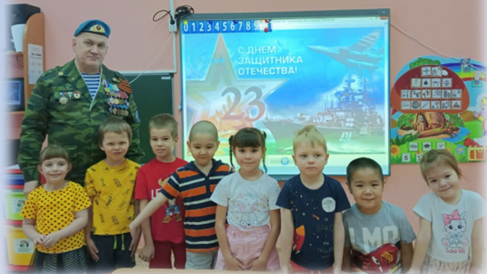
Союз ветеранов Афганистана и локальных конфликтов города Югорска