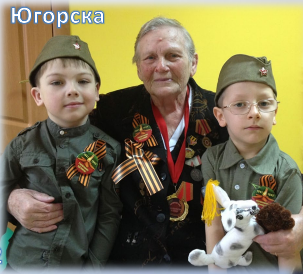
Совет ветеранов города Югорска