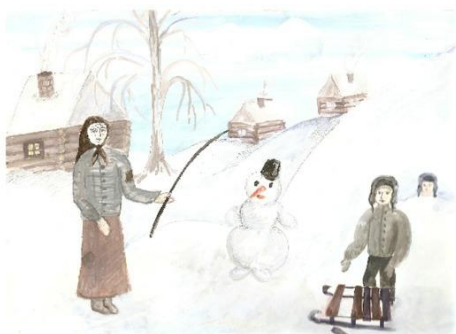
В.П.Астафьев. Фотография, на которой меня нет.