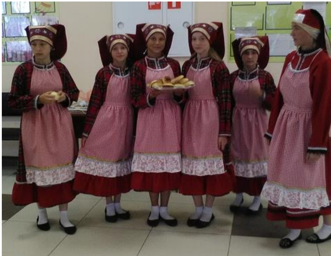
Городище «Кала башы» («Главная крепость»)