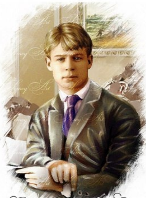
Сергей Александрович Есенин 1895-1925г