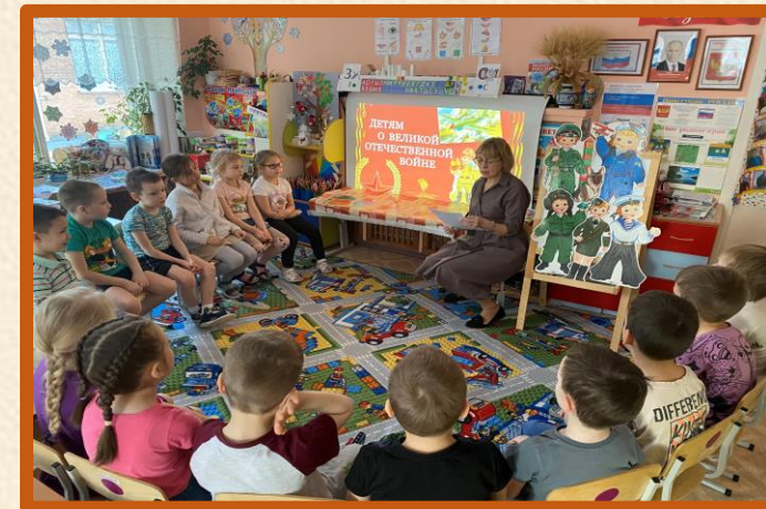
Занятие «Герои – разведчики ВОВ»