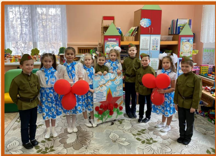
Коллективная открытка «Помним, гордимся...»