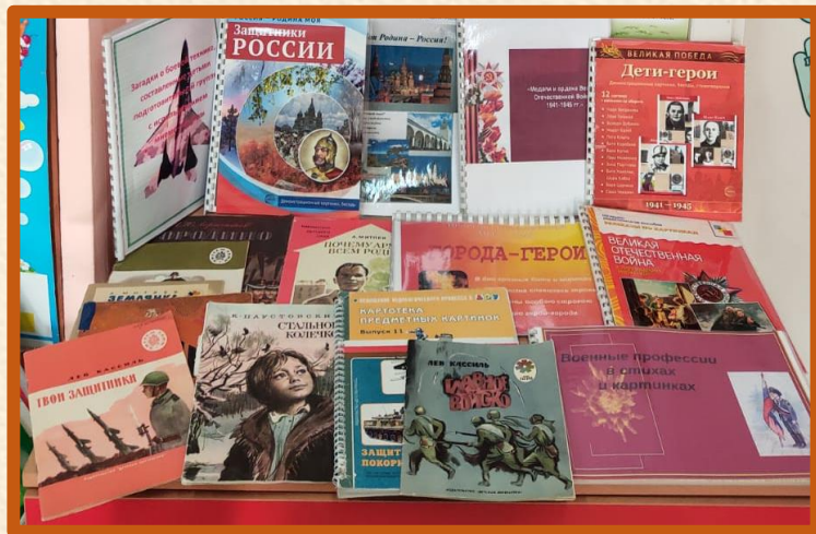
Чтение детям о войне