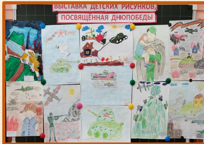
Выставка детских рисунков