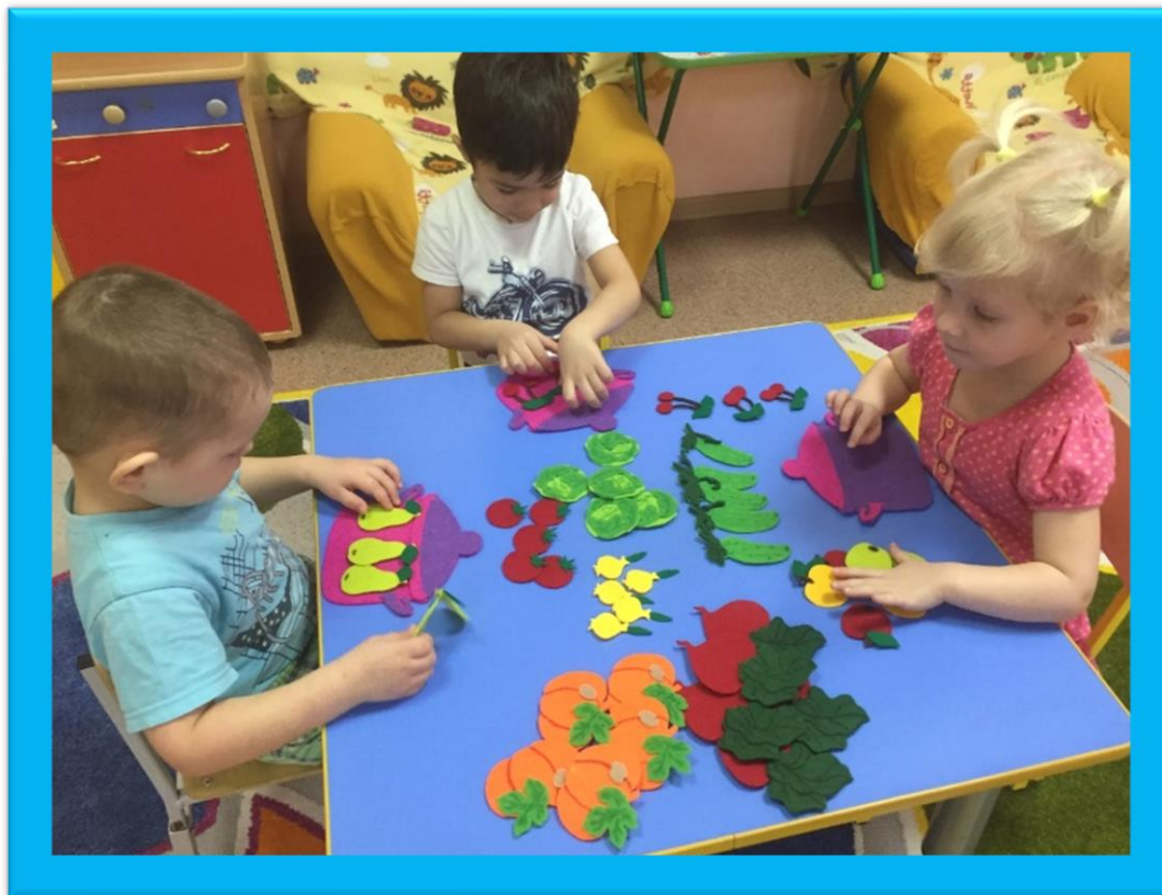
«По экологической тропинке»